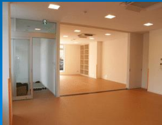
内部写真