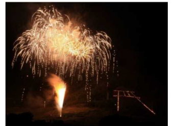
【ぶどうまつりでの鳥居焼き】

国宝「大善 だいぜんじ 寺本堂」や重要伝統的建造物群保存地区等と、武田信玄の菩提寺・恵林寺のしんげんさんや甲州街道勝沼宿におけるぶどうまつり等からなる歴史的風致の維持向上を図るため、伝統的建造物群保存地区環境整備や農業基盤整備促進、歴史文化の発信事業等が位置づけられています。