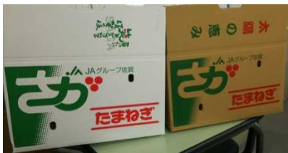
⑦佐賀たまねぎ 【佐賀県農業協同組合】