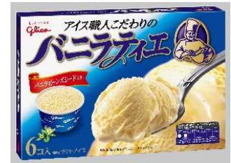
⑥バニラティエ 【江崎グリコ 株式会社】