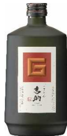
⑤吉助 【霧島酒造 株式会社】