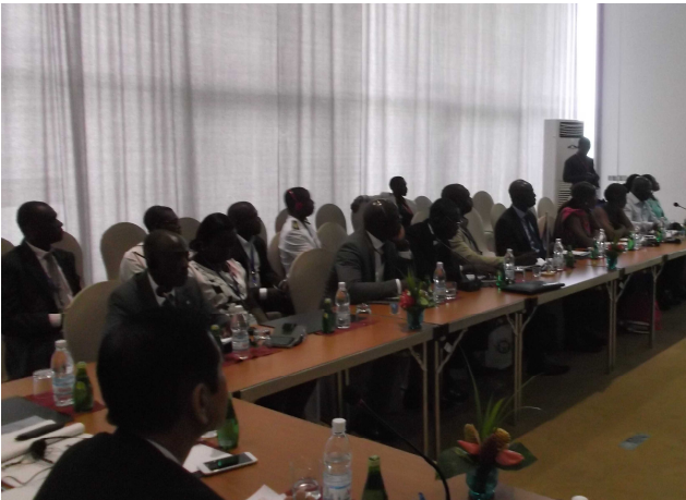
<ワークショップの様子>