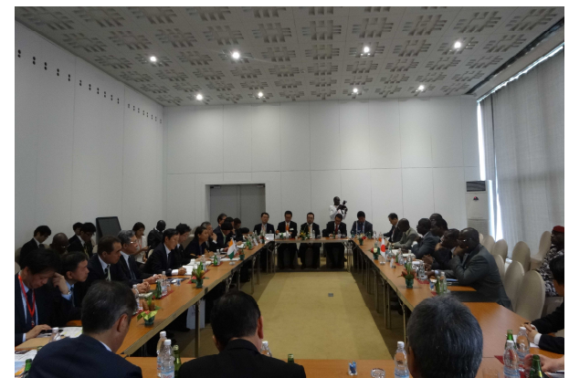
<日本企業とのアシ大臣、トゥーレ大臣意見交換>