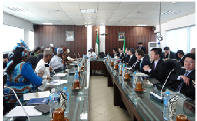
<ザカリ交通次官表敬>