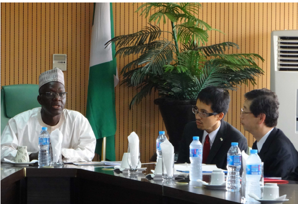
<ロロ外務次官表敬>