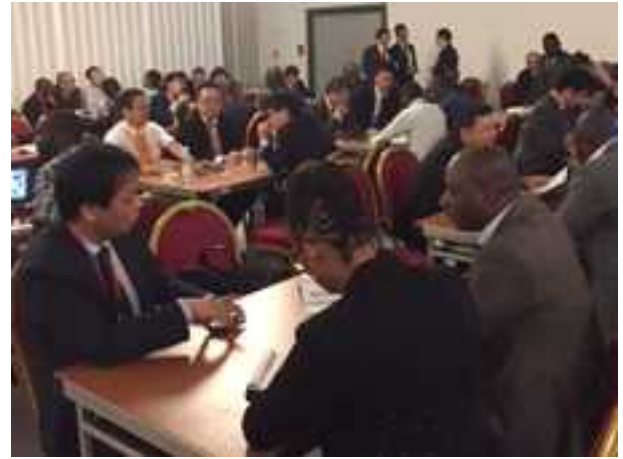
<ビジネスマッチングの様子>