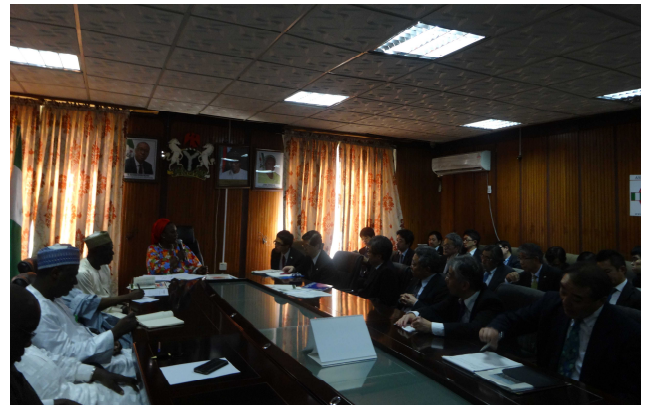
<アブバカル国務大臣表敬>