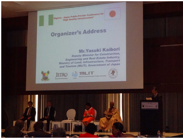
<海堀審議官冒頭挨拶>