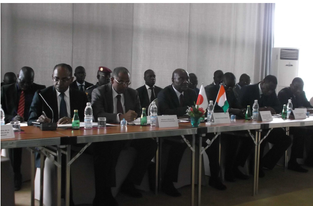
<ダンカン首相との意見交換>