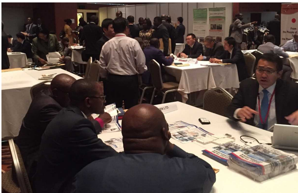
<ビジネスマッチングの様子>