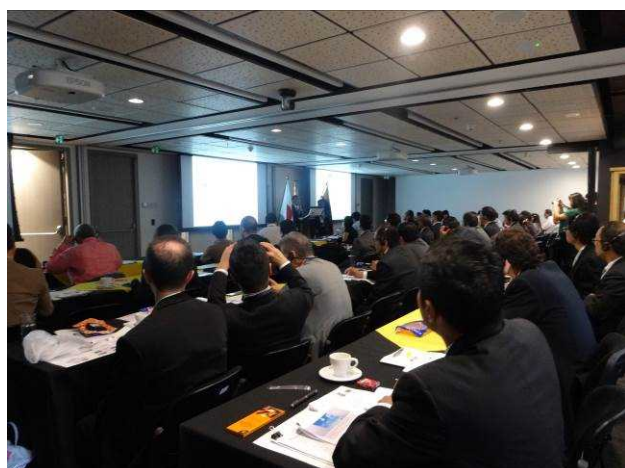
▲セミナー会場の様子