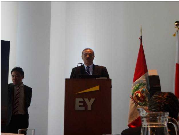
▲ドゥムレル住宅建設上下水道大臣 による開会挨拶