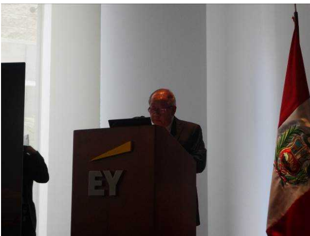
▲フリオ・クロイワ名誉教授による講演