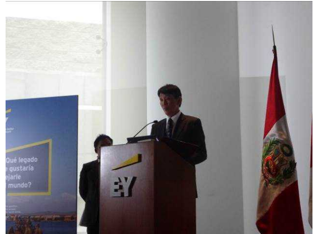
▲株丹大使による開会挨拶