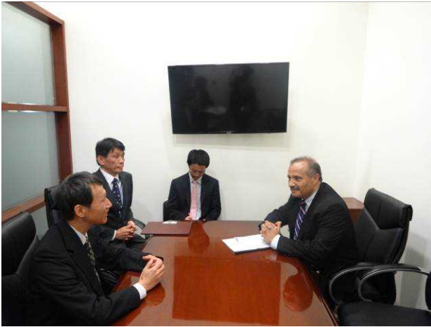
▲ドゥムレル住宅建設上下水道大臣との 会談