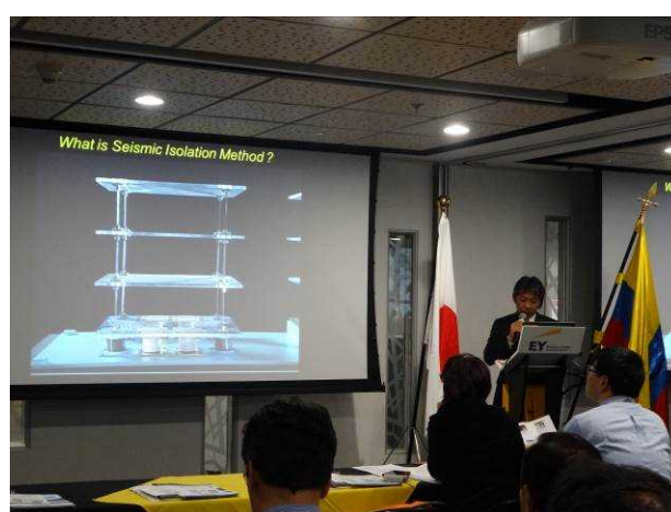
▲日本企業による技術紹介