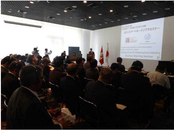
▲セミナー会場の様子