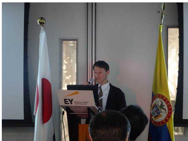
▲木暮審議官による開会挨拶

った後、日本企業からの自社技術紹介等を踏まえて、学生との意見交換会を実施しました。午後には、ボゴタ市南部ソアチャ市の環境に配慮されたメガ都市プロジェクト「グリーンシティ」を訪問し、コロンビアにおける都市・住宅インフラ整備の一例を視察しました。