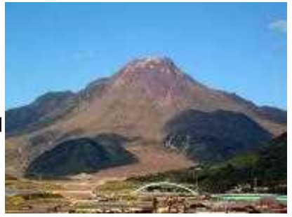
島原半島ジオパーク

世界的な活火山・雲仙火山が引き起こした災いと、雲仙火山が創る素晴らしい自然の恵みが体感できる。活火山をテーマにした世界ジオパークは、世界的にもあまり例がない。