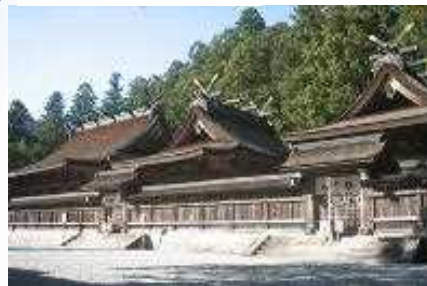
紀伊山地の霊場と参詣道

それぞれの起源や内容を異にする「吉野・大峯」、「熊野三山」、「高野山」の三つの「山岳霊場」とそこに至る「参詣道」が生まれ、都をはじめ全国から人々の訪れる所となり、日本の宗教・文化の発展と交流に大きな影響を及ぼした。