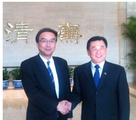
森重 国交審 (左) と馮 交通運輸部副部長 (右)

【問い合わせ先】 総合政策局国際政策課 堀、出澤 TEL : 03-5253-8111 (内線 25902、25923)、03-5253-8318 (直通) FAX : 03-5253-1561