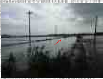
②一級河川 西仁連川 一級河川 飯沼川