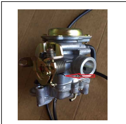
基準不適合発生箇所