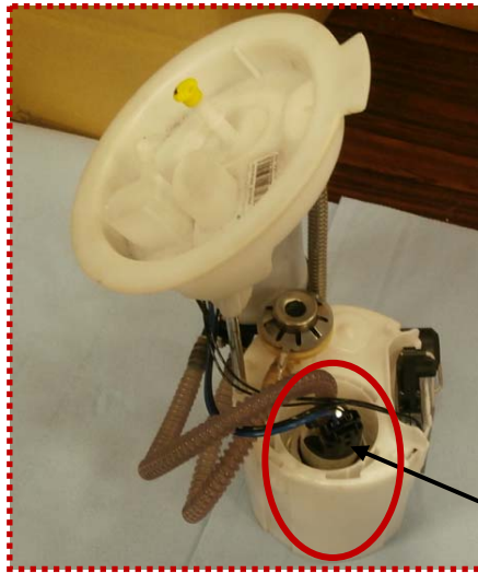
燃料供給ユニット