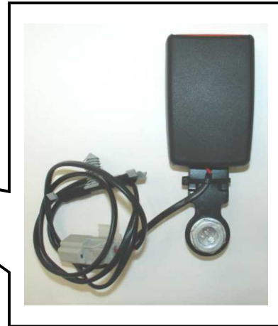
基準不適合発生箇所 シートベルトバックル