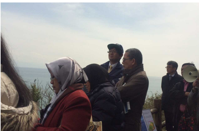
由比の地滑り対策現場の視察