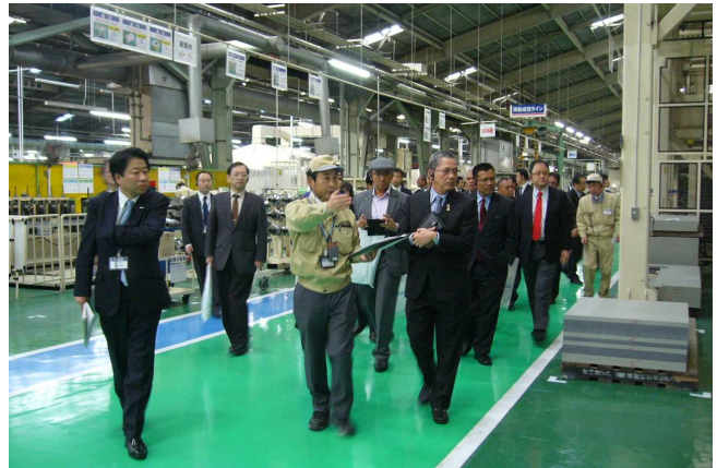
プレハブ住宅工場の視察