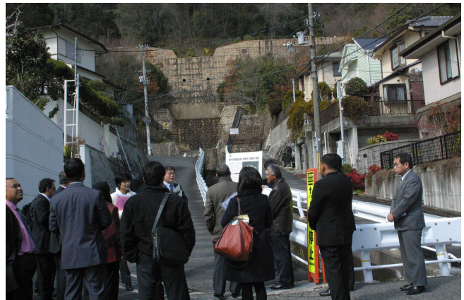
六甲の砂防堰堤の視察