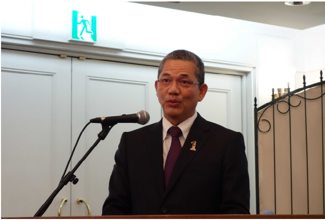
意見交換会で挨拶されるファディラ大臣