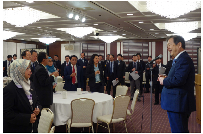
意見交換会で挨拶される北川副大臣