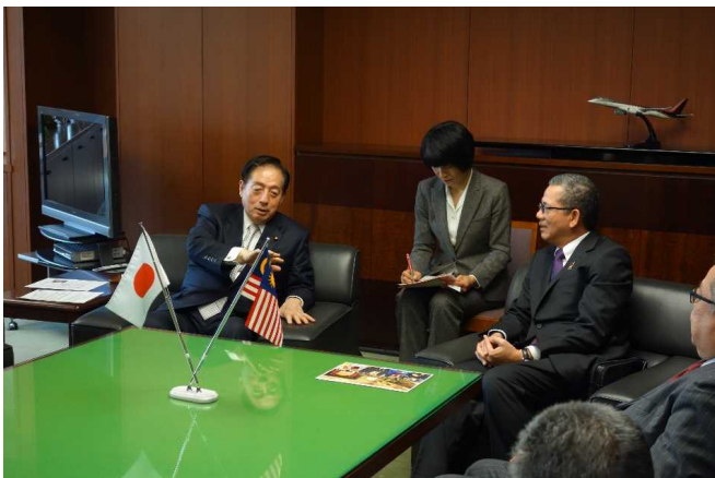
太田大臣とファディラ大臣の会談（1）