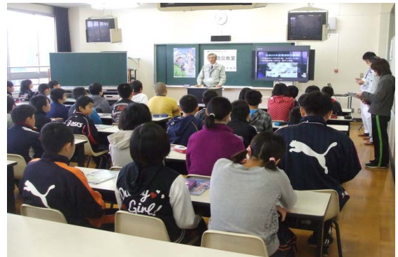
小学生を対象とした雪崩災害教室(青森県)