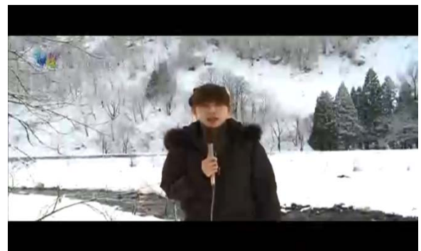
テレビ放送による啓発(福井県)