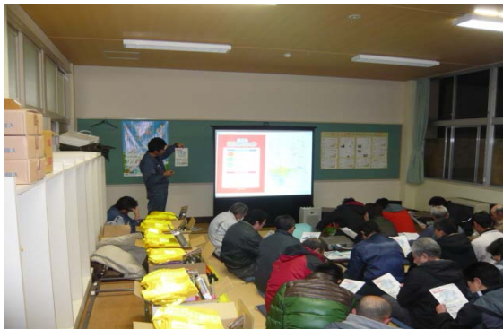
地域住民への注意喚起説明会(秋田県)