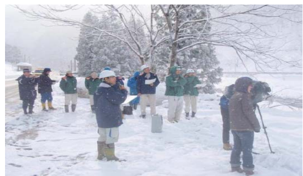
県・市町村雪崩危険箇所合同パトロール(福井県)