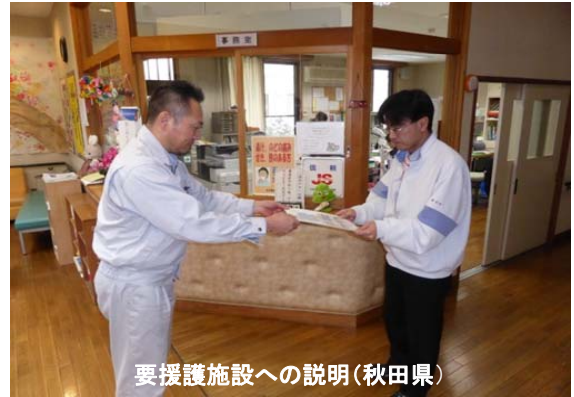
要援護施設への説明(秋田県)