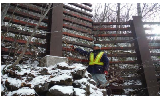
雪崩防止施設点検(栃木県)