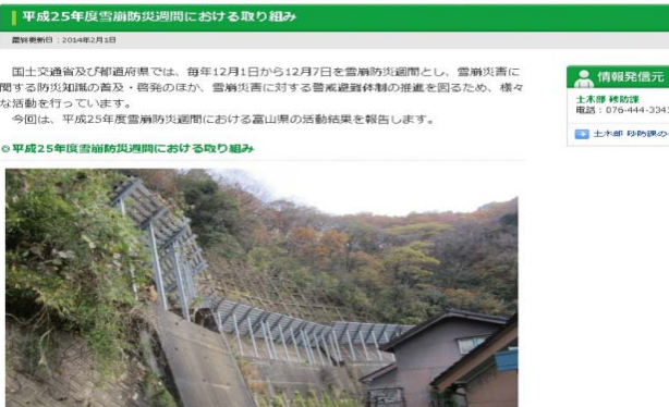
点検結果の公表(富山県ホームページ)