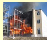
防火壁による延焼防止性能の検証