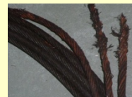
エレベーターのワイヤロープ破断事故