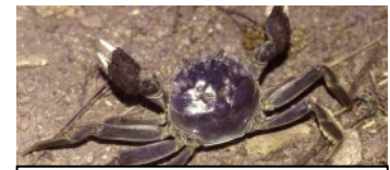
中国モズガニによる漁業被害 (1910年代～ 欧州・ドイツ、バルト海)