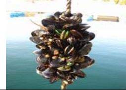
ムラサキガイによる漁業被害 (1970年代～ 日本・広島湾等)