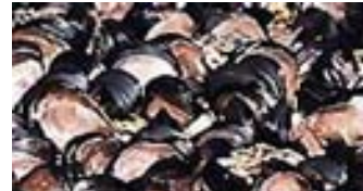
ゼブラガイによる発電所被害 (1989～2000 米国・五大湖)