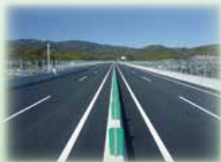
京都第二外環状道路 (長岡京 IC 付近)

定員 入場無料：先着300名 (事前の申し込みをお願いします。) 要約筆記・手話通訳・ループ(補聴器を補助する機器)、保育サービスがあります。(要予約)