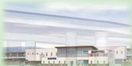
阪急京都線「西山天王山駅」