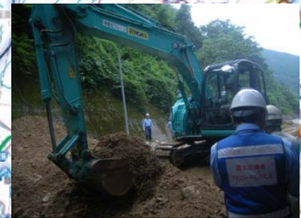
孤立集落解消に向けた土砂撤去 【国道315号金山谷トンネル坑口付近】