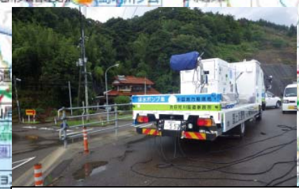
浸水対応のため排水ポンプ車の出動 【高津川派川南田川水門】