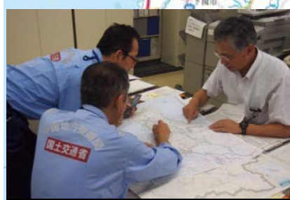
リエゾン派遣：被災情報・要請内容等の把握【山口県庁】