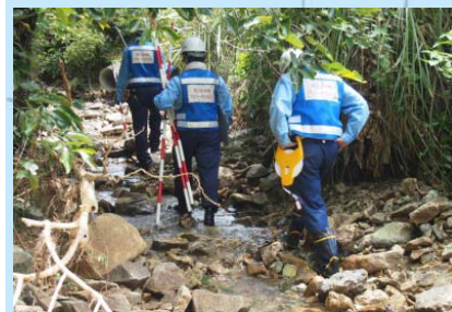
土砂災害の状況把握に向かう隊員 【山口県萩市須佐(神田川)】