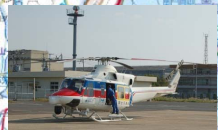
防災ヘリコプターによる (緊急) 被害状況調査