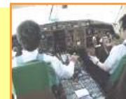
飛行中の業務 状況の確認