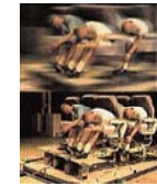
(座席の動的荷重試験) 国内で製造され、輸出 される航空製品の安全 性について確認