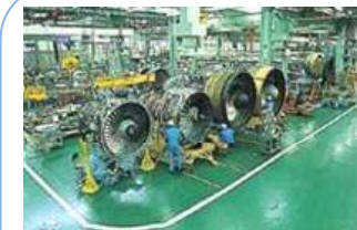
エンジンのオーバーホール を行う事業場