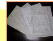
訓練記録等の 書面を確認

審査に合格した規程類に従って適切に業務が実施されているかについて、定期的及び随時に本社や運航・整備の現場等に立入検査を行うなど、専門的かつ体系的な監査を高頻度で実施