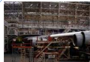
大型機の重整備を 行う事業場

航空機の整備等を行う事業場は、国の認定を受けることで、本来 国が行う業務の一部を国に代わり実施 することができます。その際、国内外の申請者に対し、設計・製造・整備等の能力・体制に関する審査、認定及びその後の監督を行っています。このように、 民間の能力を最大限に活用 した、簡素で合理的な行政システムの推進に努めています。