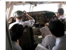
コックピットに搭乗して、 通常の運航では使用されない 機能等を検査