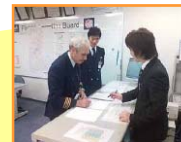
飛行前の業務 状況を確認