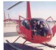
耐空証明検査 書類チェック・地上試験 のあと飛行試験を実施

航空機の安全性を確保するために、航空機の 耐空性や環境適合性の基準等を策定 すると共に、航空機がこれらの基準に適合しているかを確認するために、機体一機毎に 耐空証明検査を実施 しています。その他、航空機の型式毎に設計・製造過程の基準適合性を確認する 型式証明検査等 を通じて航空機の安全性の確保に努めています。