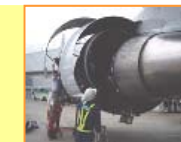
飛行間の業務 状況を確認