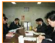
各部門にヒアリング

運航及び整備の方法や体制を具体的に定めた規程類の審査を通じて、必要な情報収集、技術的分析、トラブル等の処置の判断が確実に実施できる能力を有しているかについて書類検査・実地検査を行うことで、航空会社が行う運航及び整備の安全性をチェック