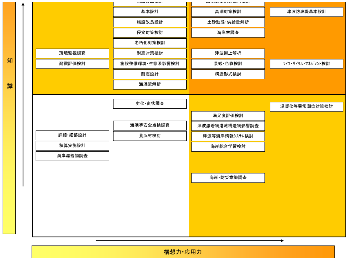
図 海岸調査・設計業務の例