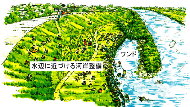
「水辺の楽校」のイメージ図