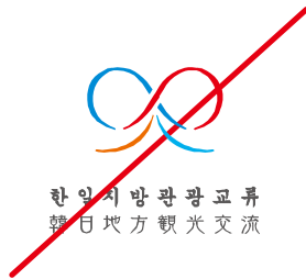
● 書体とバランスを変更する