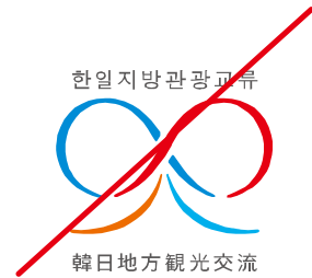
● 組み方を変更する