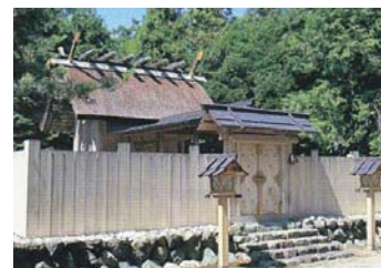
【斎宮の旧跡地に存する竹神社】

史跡「斎宮跡」、三重県指定史跡「坂本古墳群」を含み、神聖な場所として古くから住民に守り続けられている斎王の森・竹神社や斎宮復興運動の拠点となった地域を重点区域とし、斎宮跡の建造物や古代伊勢道の復元、坂本古墳群の史跡公園としての整備、史跡内から流末河川に至る幹線排水路の整備、誘導案内板の整備、伊勢街道沿いの歴史的建造物の実態調査等の事業が位置付けられています。