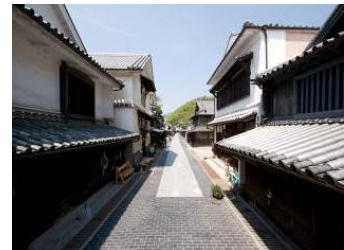
【竹原市竹原地区の町並み】

重要伝統的建造物群保存地区「竹原市竹原地区」を含み、製塩業や酒造業の発展により形成された歴史的町並みが現存する地域を重点区域とし、竹原市重要文化財「森川家住宅」の保存修理、重要伝統的建造物群保存地区へのアクセス道となる市道の整備、景観計画の策定、住吉祭・蒲団太鼓をはじめとした伝統行事の記録保存等の事業が位置付けられています。