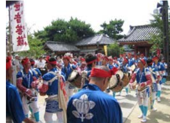
【吉和太鼓おどりと浄土寺境内】

国宝「浄土寺多宝塔」、重要文化財「常称寺本堂」等を含み、中世から近世の文化財が重層的に存在し特徴的な市街地を形成している尾道・向島地区、及び国宝「向上寺三重塔」を含み、港町としての繁栄を今に伝える歴史的町並みが現存する瀬戸田地区の2箇所を重点区域とし、浄土寺・常称寺の保存修理、歴史的建造物を回遊する散策道的美装化、歴史的建造物の修景・修復助成、ベッチャー祭をはじめとした民俗芸能への支援等の事業が位置付けられています。