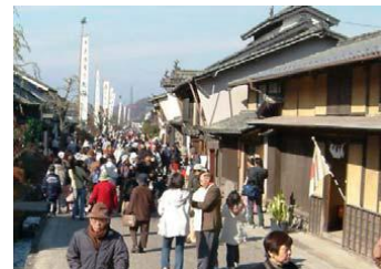
【白鳥神社例祭と海野宿の町並み】

重要伝統的建造物群保存地区「東御市海野宿」を含み、江戸時代は北国街道の宿場町として、明治時代以降は養蚕・蚕種業の町として栄えた伝統的な町並みが現存する地域を重点区域とし、海野宿内の歴史的建造物の修理、海野宿の景観に配慮した舗装・街路灯の改修、通過交通解消のための海野バイパス整備、海野宿案内ガイド育成等の事業が位置付けられています。