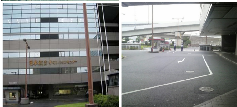
JALオペレーションセンター エントランス エントランス側車両出入口