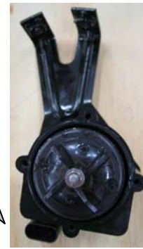
基準不適合発生箇所 ターボ チャージャー冷却用 補助クーラント ポンプ