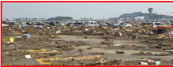
漂流物(車両・土砂・瓦礫等)による被災状況