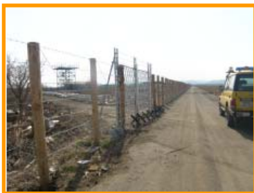
セキュリティーエリアの確保