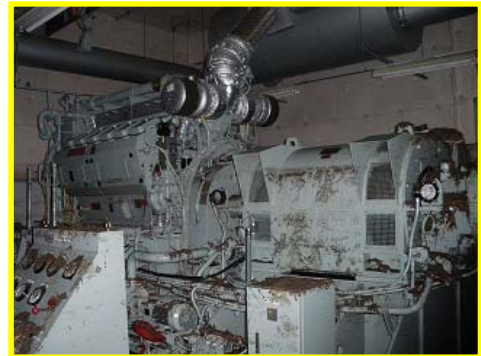
非常用発電設備の被災状況