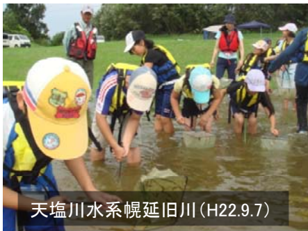
天塩川水系幌延旧川(H22.9.7)