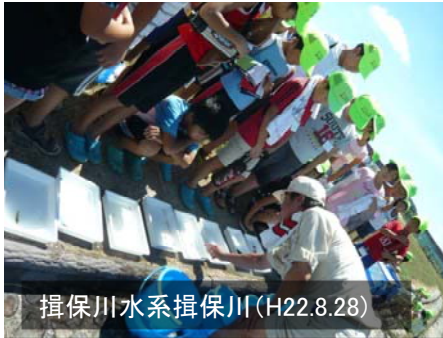
揖保川水系揖保川(H22.8.28)

平成22年度一級河川の全国水生生物調査では、夏休み期間を中心に、小中学校や市民団体等456団体、14,936人の多数の参加を頂き、539箇所の調査地点数となりました。参加者数の多い都道府県は、北海道、福島県、熊本県等でした。