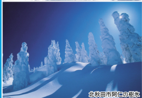
北秋田市阿仁の樹氷