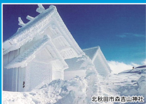
北秋田市森吉山神社