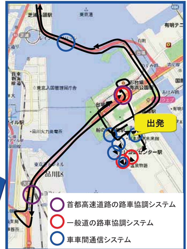
臨海副都心周辺のコース