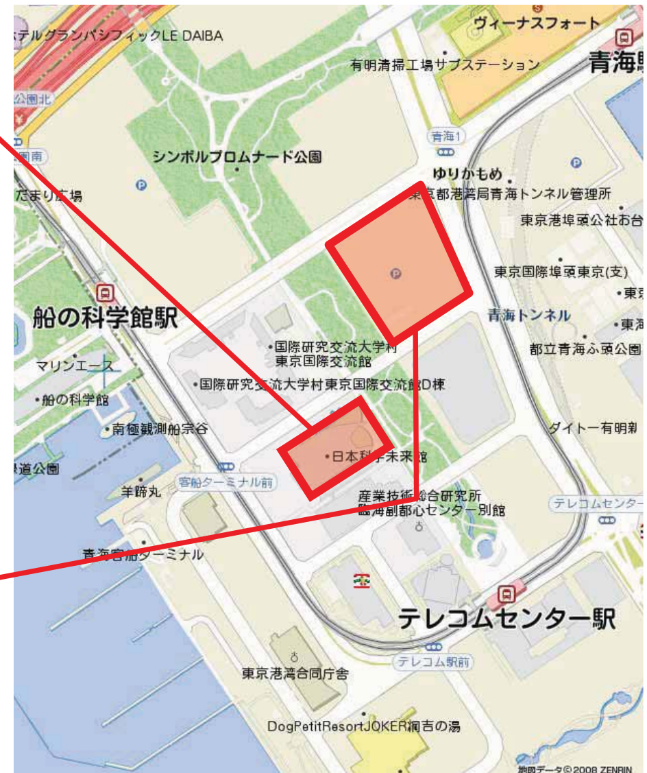
シンポジウム、展示会等会場予定地