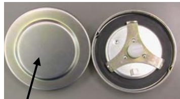
燃料タンクキャップ

燃料タンクキャップの爪部の硬度が不足しているものがあるため、使用過程において当該爪部が変形し、キャップの保持力が低下するものがある。そのため、そのままの状態で使用を続けるとキャップの保持力がなくなり、燃料が漏れるまたは、燃料タンクキャップが脱落するおそれがある。