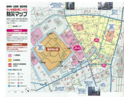
防災マップ：黄色エリア

活動エリア静岡駅北口地域及び御幸・伝馬・鷹匠・商店街沿道を主な活動エリアとしています。