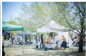
お庭でマルシェ (MUSEUM MARKET)