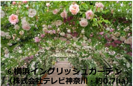
⑥横浜イングリッシュガーデン （株式会社テレビ神奈川・約0.7ha）