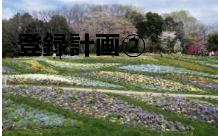
⑧里山ガーデン（横浜市・約20ha）