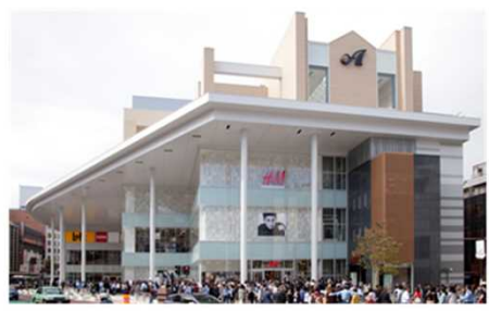
<地方都市の市街地再開発事業の事例>