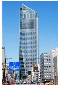
<大都市の市街地再開発事業の事例>