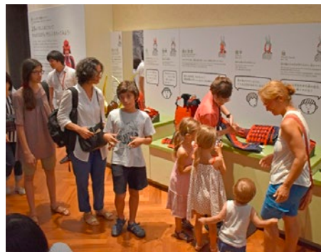
日本文化体験「日本のよらい!」の様子(東京国立博物館)