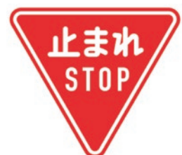
英字を併記した様式「一時停止」

2017年度（平成29年度）に英語を併記した規制標識の整備が可能となったことから、これらの道路標識を更新等に合わせて順次整備しており、2019年度（令和元年度）末現在、約112,000枚の規制標識「一時停止」について英字が併記された。