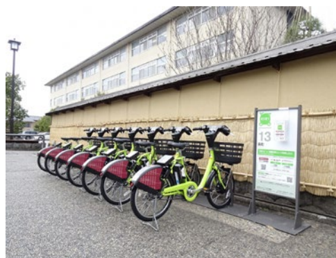
金沢市におけるシェアサイクルの導入事例(まちのり)

「道の駅」1,173駅のうち、新たに5駅で電気自動車(EV)充電施設、18駅でWi-Fiを設置し、2020年(令和2年)3月末時点で電気自動車(EV)充電施設834駅、Wi-Fi設置975駅となった。