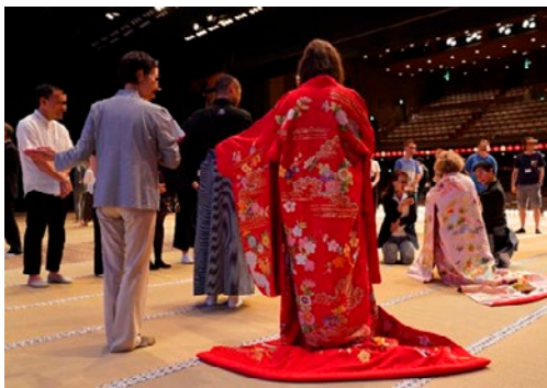
「外国人のための歌舞伎ワークショップ」 女方の演技体験(国立劇場)

2019年度（令和元年度）「日本博」プロジェクトの公募等を行い、主催・共催型69件、公募助成型69件を採択したほか、参画プロジェクト計289件を認証（2020年（令和2年）3月末時点）した。