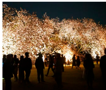
新宿御苑 八重桜のライトアップ

新宿御苑では、来園者の満足度の向上、インバウンド対策等のため、2019年（平成31年）3月19日から開園時間の延長、入園料改定、同年4月には八重桜のライトアップ、旧洋館御休所の開館拡充、2019年（令和元年）11月に菊花壇のライトアップ、同年12月に紅葉ライトアップを実施した。また、民間の夜間イベントを公募するための特別開園ルールを策定した。さらに、園内施設の拡充のためレストランの改修や民間カフェの公募を行い、2020年（令和2年）3月下旬から園内のレストハウスにて民間カフェを新規にオープンするなど、新宿御苑の魅力を高めるための取組を行った。