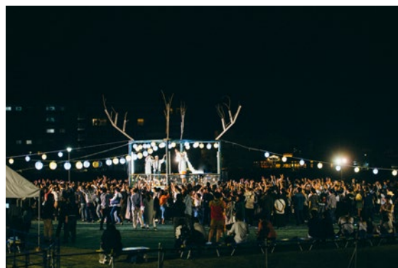
国際文化芸術発信拠点形成事業にて支援した宮城県で開催された芸術祭状況

また、芸術祭等の文化芸術事業をコアとし、他分野との有機的な連携を図ることで継続的に世界にアピールできる我が国を代表する国際文化芸術発信拠点を形成する総合的な取組（11件）に対して支援を行った。さらに、我が国の芸術団体が行う海外公演、国際共同制作公演、我が国で行われる国際的舞台芸術イベント等（36件）に対する支援を行った。地域住民や地域の芸・産学官と共に実施する地域の文化芸術資源を活用した取組に対する支援（95件）等を実施した。