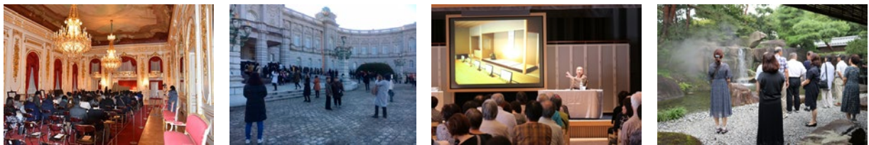
迎賓館赤坂離宮及び京都迎賓館の一般公開の状況

迎賓館の貸出を行う「特別開館」については、2019年度（令和元年度）は、使用希望はあったものの、開催時期等の利用要件を満たす事業がなく未実施となったが、事業発掘のため、あらゆる機会を捉え、民間事業者に向けた制度説明等、「特別開館」に係る情報提供に努めた。