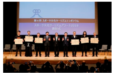
スポーツ文化ツーリズムの推進

配信するデジタルプロモーションを実施した。さらに、2020年（令和2年）1月にスポーツ庁・文化庁・観光庁主催の「スポーツ文化ツーリズムシンポジウム」を石川県金沢市で開催し、前年比300%の約650人が参加した。同シンポジウムでは、計6件の取組を「スポーツ文化ツーリズムア