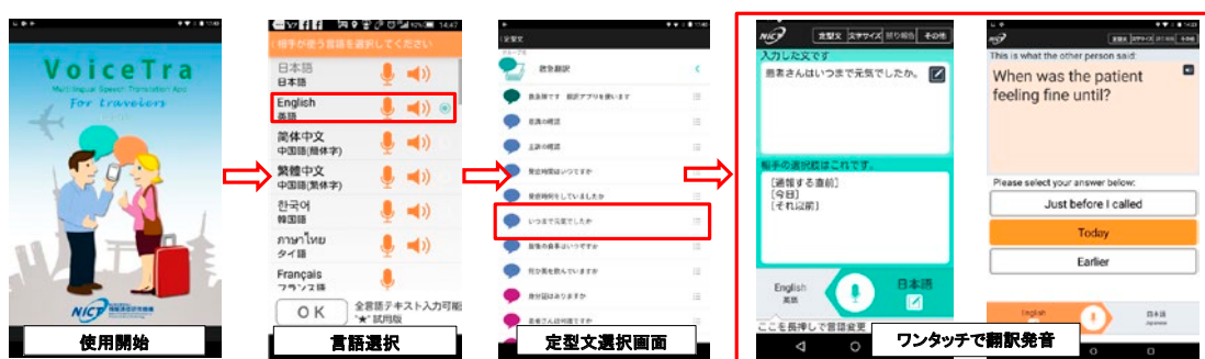
救急現場において、救急隊が活用する多言語音声翻訳アプリ

さらに、2019年（令和元年）8月に、コミュニケーションボード等の外国人傷病者に対応する手段については、全国の消防本部での活用状況について調査した。