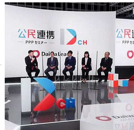
※2022年度に開催したセミナーの様子、オンラ インを活用し全国に生配信しました