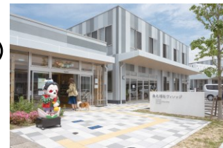
写真: 多世代共生型施設整備事業及び公 園整備事業 桑名福祉ヴェレージ