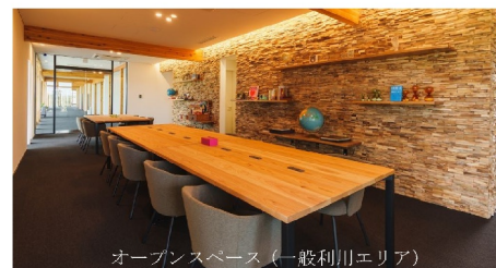
オープンスペース（一般利用エリア）