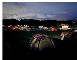
▲夜間のキャンプ風景