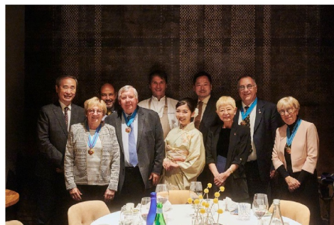
フランス、ルーアンの有名レストラン、Gillでのマリアージュの会