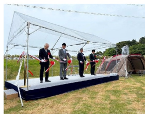
▲オープン式典の様子