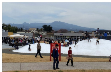
開駅式後の一般利用の状況②（芝生広場）