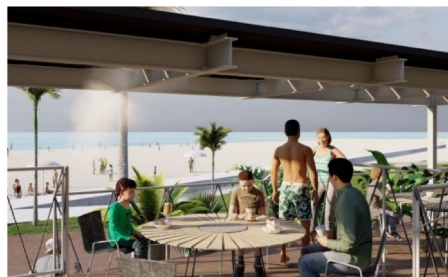
▲客室のテラスのイメージ