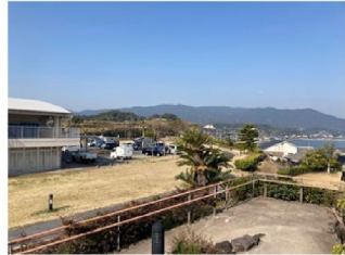
展望台より施設背後