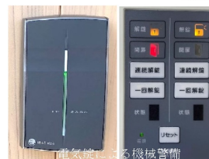
電気錠による機械警備