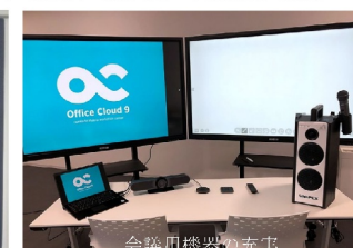
会議用機器の充実