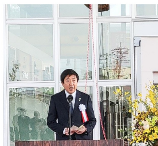
主催者代表 山本龍前橋市長 挨拶