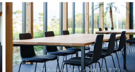
シェアスペース（オフィス専用エリア）