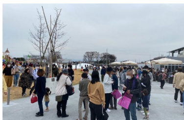
開駅式後の一般利用の状況①（屋外）