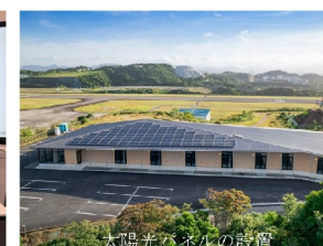
太陽光パネルの設置