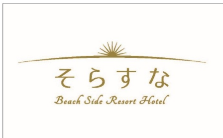
▲「そらすな」のロゴマーク