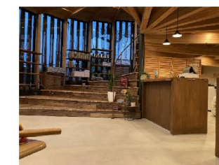
▲管理棟内部の様子