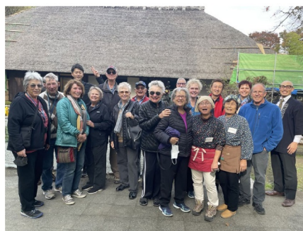
あしがり郷瀬戸屋敷でのインバウンド観光