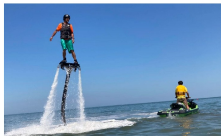
▲マリンアクティビティ(フライボード)

※詳細はこちらから https://www.oriconsul.com/news/