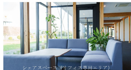
シェアスペース（オフィス専用エリア）