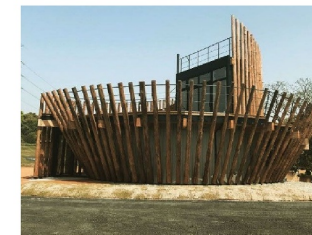
▲管理棟の外観 (園内の間伐材を利用)