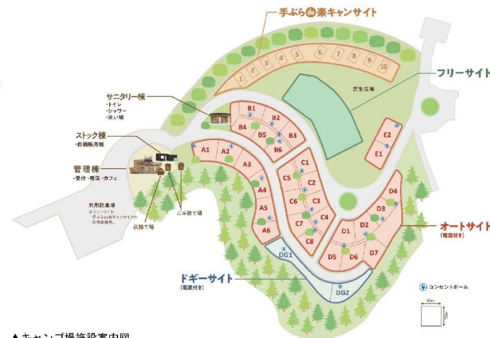
▲キャンプ場施設案内図

福岡県北九州市響灘緑地にキャンプ場「HIBIKINADA CAMP BASE」を開業 ～事業者として、自らの投資により地域活性化に貢献～