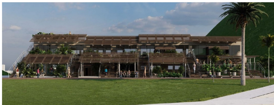
▲外観のイメージ (客室の海側を覆う巨大な木製の階段)

11月4日(土)体験型研修宿泊施設「そらすな」オープン式典を開催 ～自らの投資による地域活性化を始動！～