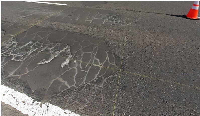
※写真は正解値測定時（交通規制中）