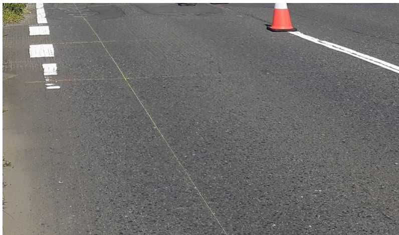
※写真は正解値測定時（交通規制中）