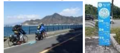
矢羽根型路面標示やルート案内等の設置