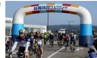
「富山湾岸サイクリング」を毎年開催