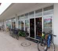
柳島スポーツ公園(ゲートウェイ)