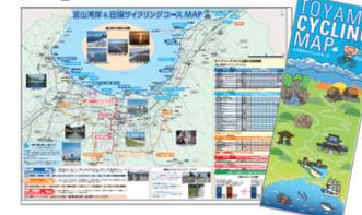
マップ(日・英・中の3言語)を作成