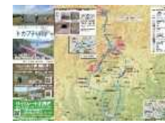
マップ(日・英・中(繁)・タイ)