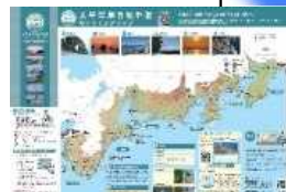
マップ(日・英)を作成し、ホームページ等で紹介