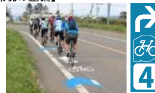
矢羽根型路面標示やルート案内等の設置