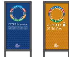
サイクルステーションやサイクルカフェの看板(サイクルラック設置や修理工具貸出等)