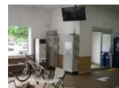
帯広駅バスターミナルおびくる(ゲートウェイ)