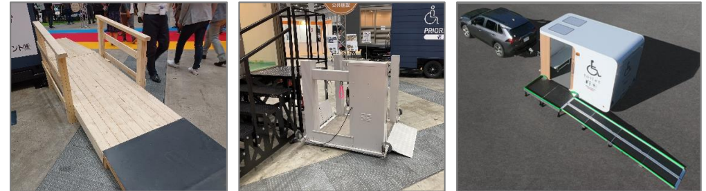
図 段差の解消方法（低床式車両の導入／スロープ・リスト設置）

「道の駅」は、様々な人が利用する施設であるため、コンテナの設置にあたっては、バリアフリーや、ユニバーサルデザインへの配慮を図る