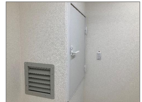
図 コンテナ内部の陰圧装置