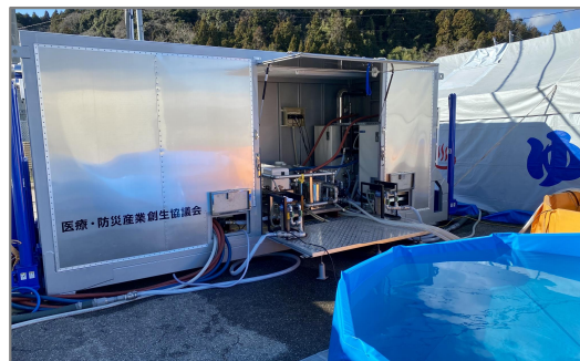
図 災害時におけるボイラーコンテナの状況