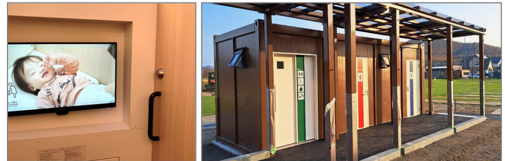
図 施錠ができる授乳室

コンテナの用途によってプライバシー確保への配慮が必要であり、更衣室やトイレ、簡易シャワー、診療所等においては、特に、その配慮が重要