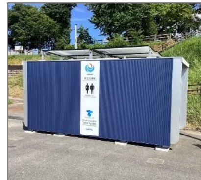
図 平常時の設置(道の駅「うきは」)