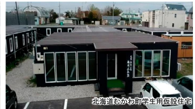
図 平成30年7月豪雨災害や北海道胆振東部地震の被災地で利用されたトレーラーハウス・モバイルハウス