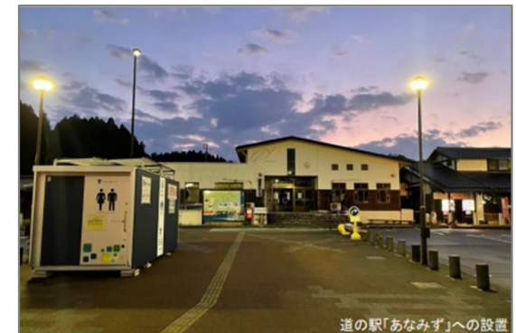
図 災害時の設置(道の駅「あなみず」)