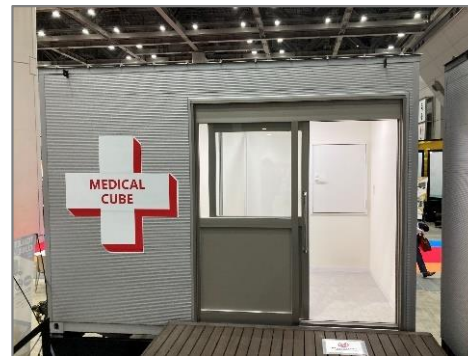
図 診療コンテナの外観