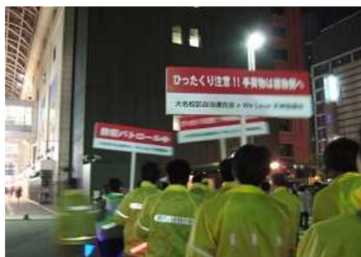
天神合同防犯パトロール