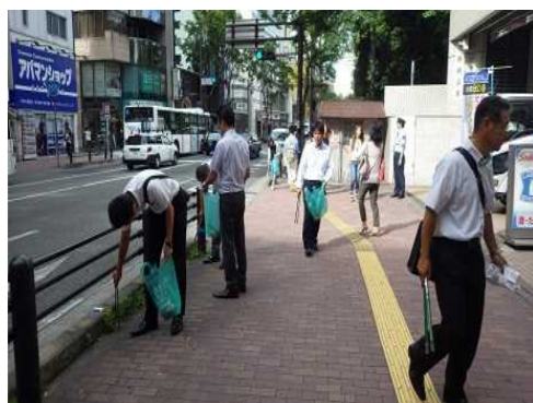
天神クリーンデー