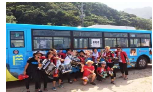
福岡ミュージックマンス（9月）