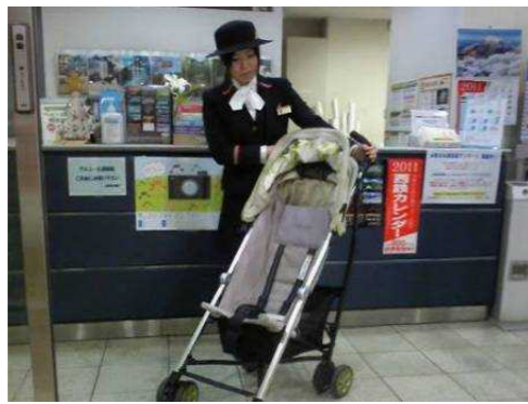
ベビーカー無料貸出サービス