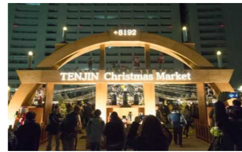
天神クリスマスマーケット（12/4～25）