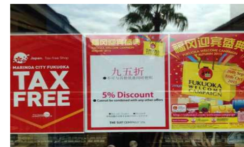
FUKUOKA WELCOME CAMPAIGN