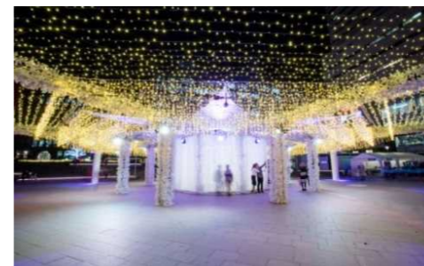
警固公園イルミネーション（11/13～1/12）