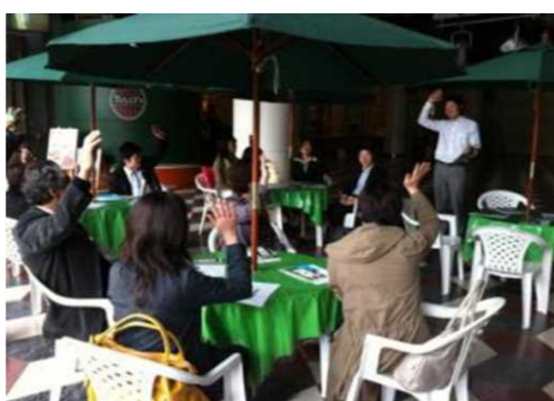
天神まちづくり学科