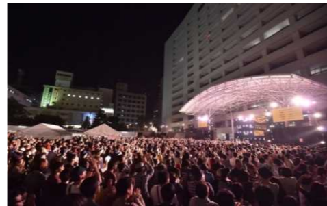
Music City Tenjin（9/26～27）