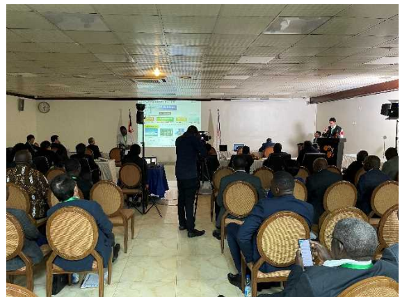
JAIDA 会員企業からの登壇発表