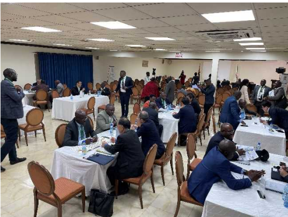
ビジネスマッチングの様子

午後には、JAIDA 会員企業とウガンダの参加者によるビジネスマッチングイベントが開催され、参加者同士の関係づくりや情報交換が行われた。