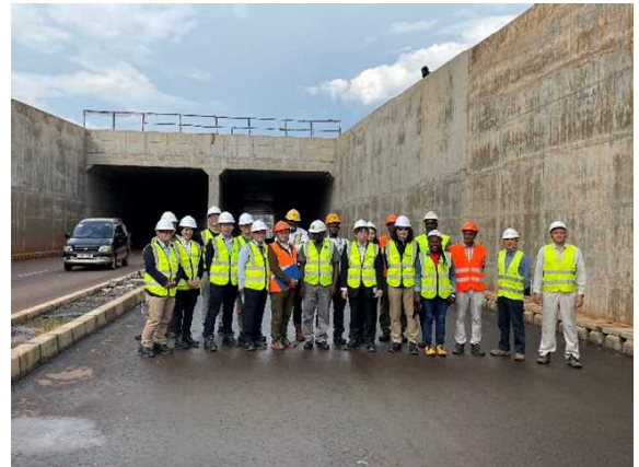
視察中の集合写真