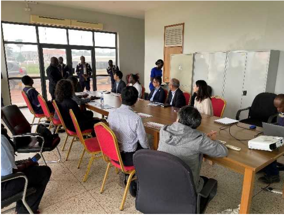
UNRA からの説明の様子