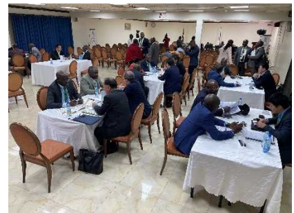
ビジネスマッチング

※1：2016年8月に開催されたTICAD VI（ケニアにて開催）を契機として、2016年9月に本邦インフラ関連企業を中心として設立された会議体（JAIDA）。アフリカ各国との関係構築を図ること、並びにインフラ案件の発掘及び形成を官民連携して促進することを目的としている。