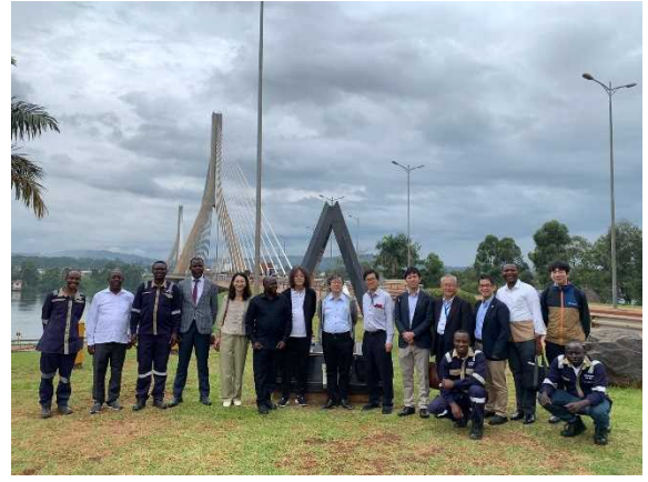
ナイル川源流橋での集合写真

ワークショップの翌日 12 月 6 日（水）には、清水・鴻池 JV が手掛ける「カンパラ立体交差建設・道路改良計画」の施工現場を訪問し、現場視察を行った。