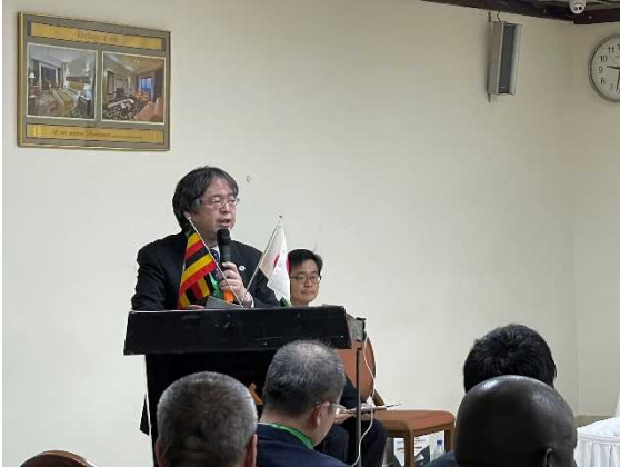
垣下大臣官房参事官 開会挨拶