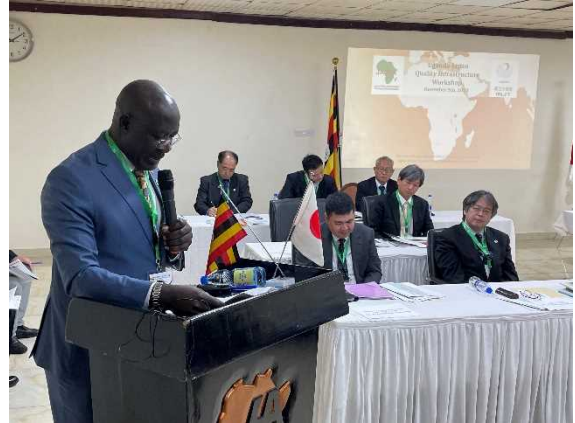
エチュウェル副大臣 開会挨拶