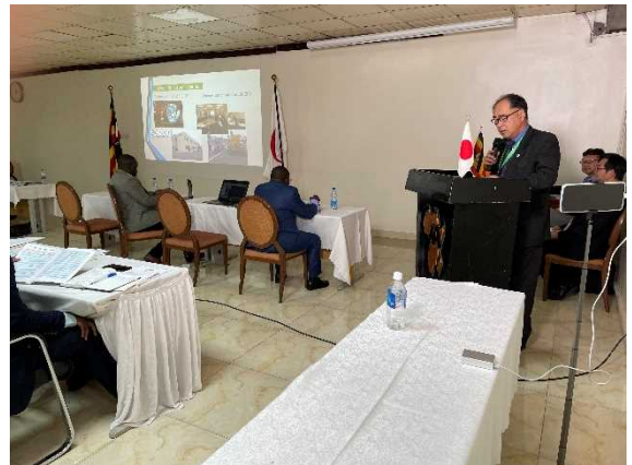
酒井重工業株式会社 登壇発表