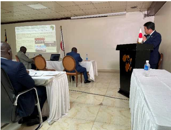
株式会社フジタ 登壇発表