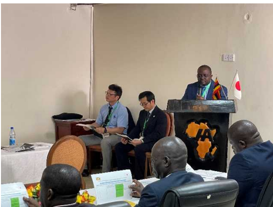
公共事業運輸省 基調講演