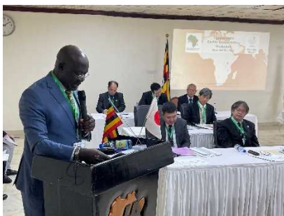
エチュウエル副大臣開会挨拶