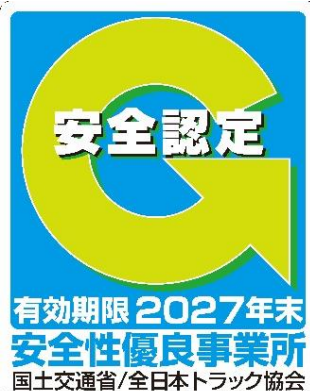
認定マーク『Gマーク』

Gマーク（安全性優良事業所）は、全日本トラック協会が認定（国土交通省推奨）する評価制度です。今回の認定により、Gマーク事業所は全国で 29,044 事業所（全てのトラック事業所の 33.6% 、対前年度比 0.8 ポイント増。）となり、更に、安全運行を励行するトラックが増えています。トラックはひとたび事故を起こせば、重大事故に発展することが多く、被害は甚大です。2022年（1月～12月）の事業用トラック1万台あたりの事故件数をとりまとめたところ、Gマーク認定を取得したトラックの死亡・重傷事故の件数は、認定を取得していないトラックと比較して 20% 以下となっています。