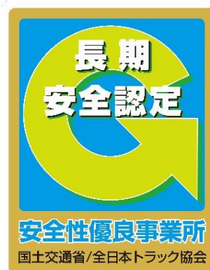
長期認定事業所用『ゴールドGマーク』