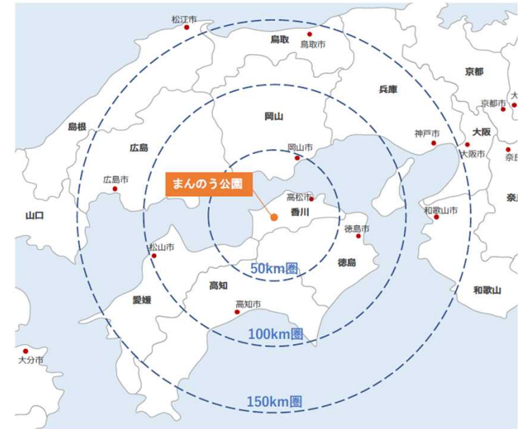
図:公園の位置(広域)