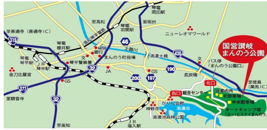
図:公園の位置(周辺拡大)