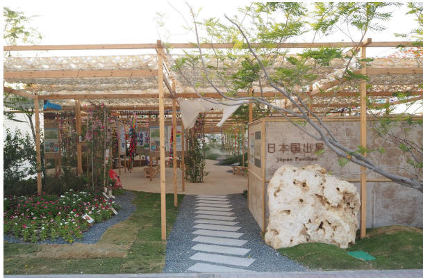
開館した日本国政府出展

10月2日（月）に博覧会事務局主催の全体開会式が行われました。また、翌3日（火）には、日本国政府出展の開館式が行われ、ドーハ国際園芸博覧会事務局長やAIPH 会長等にご出席いただきました。