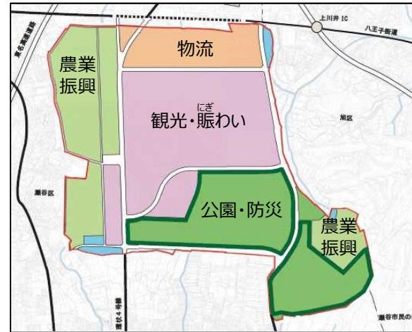
旧上瀬谷通信施設地区土地区画整理事業

2027年国際園芸博覧会の準備及び運営に関する施策を推進するに当たり、横浜市等の要望を参考として、「2027年国際園芸博覧会の開催申請について」（令和3年6月22日閣議了解）を踏まえ、本博覧会開催の効果を向上させる事業を定め、整備を進める。