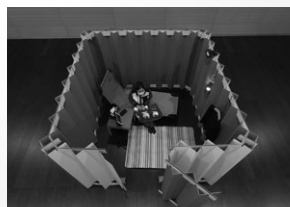
建設業界の災害対応(KAMIKABE)