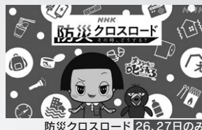
防災クロスロード 26、27日のみ