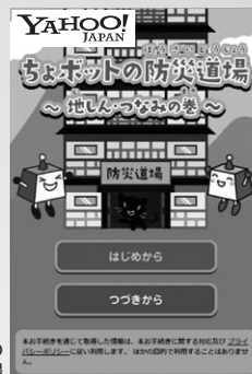
ちょボットの防災道場