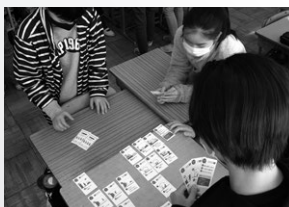
防災カードゲーム