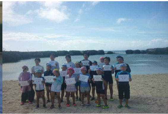
宝島 十島村山海留学