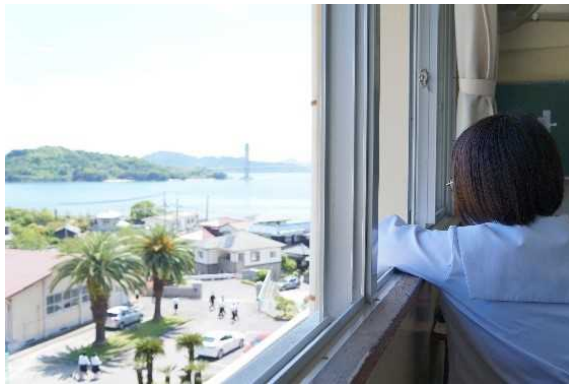
弓削島 弓削高等学校生徒全国募集