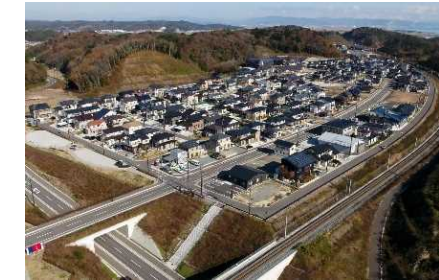
宮城県東松島市野蒜北部丘陵地区