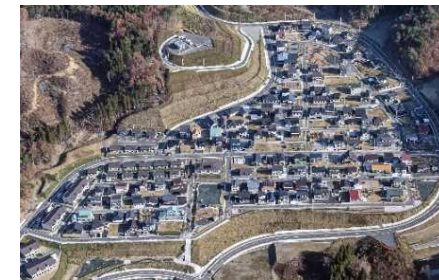
岩手県宮古市田老地区