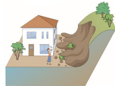
防災上の観点から適正な管理が求められる土地の例(イメージ)