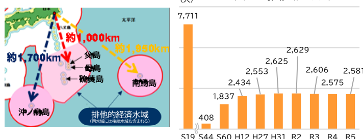
人口の推移（住基人口）